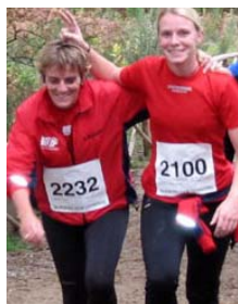
2 hgf-løbere som - bedømt på smilet - tænker på sandwich

Planlæggerens kort var måske uden højdekurver. I hvert fald førte han ruten ned i Granslev Ådal af den første mulige (eller måske rettere umulige) vej. Cykelbakken var født!